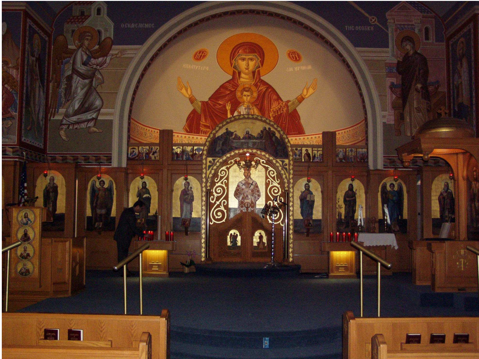
La Nave de la iglesia ortodoxa de San Juan Bautista, Tampa, Florida