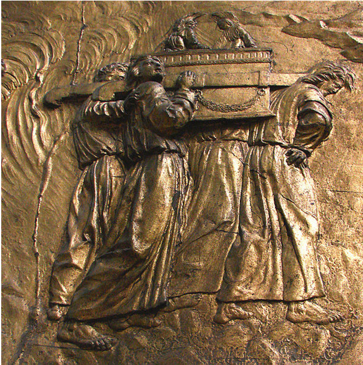
Portando el Arco del Convenio Relieve Catedral de Auch, Francia