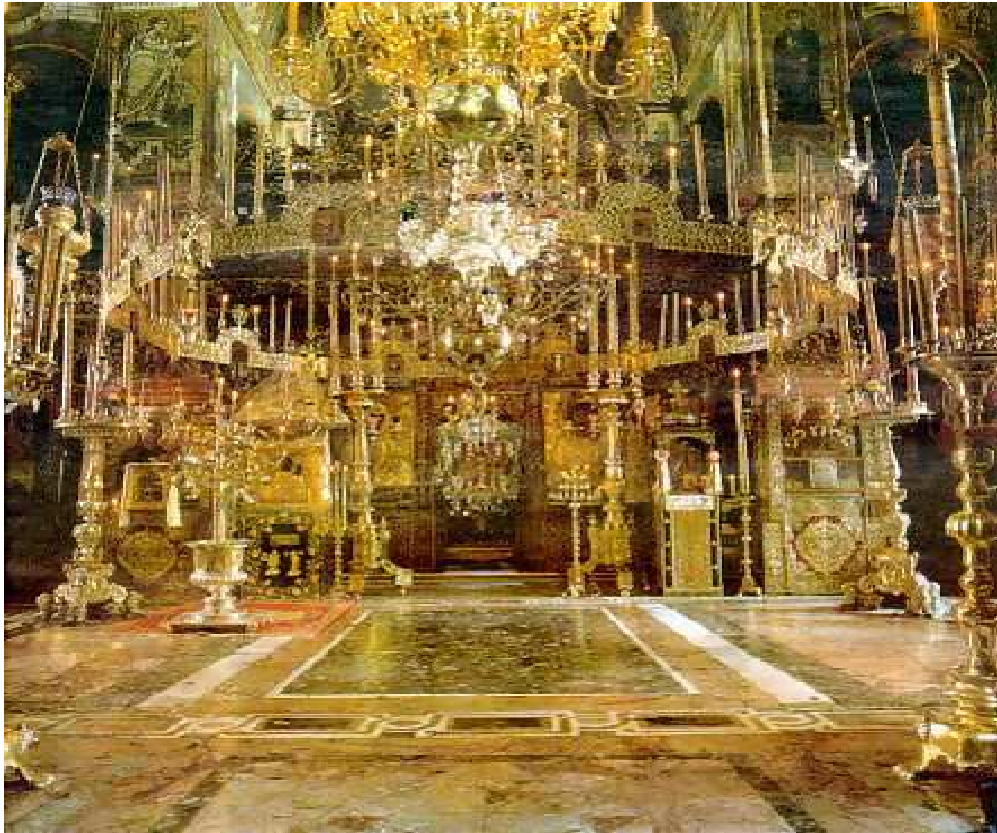
La Nave o el Santo Lugar (Monte Atos)