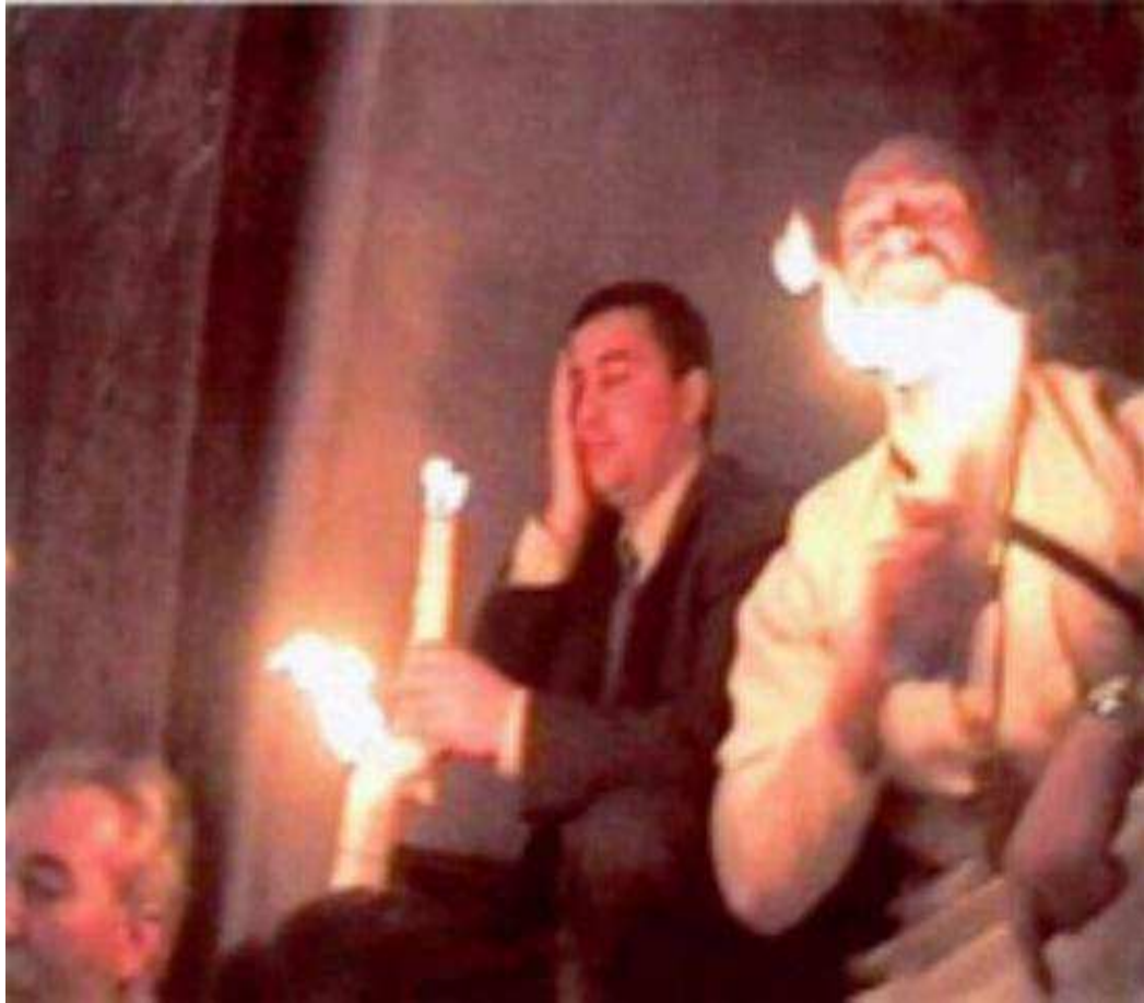
La Santa Luz llamado del Sepulcro La Iglesia del Santo Sepulcro, Jerusalén http://www.holyfire.org