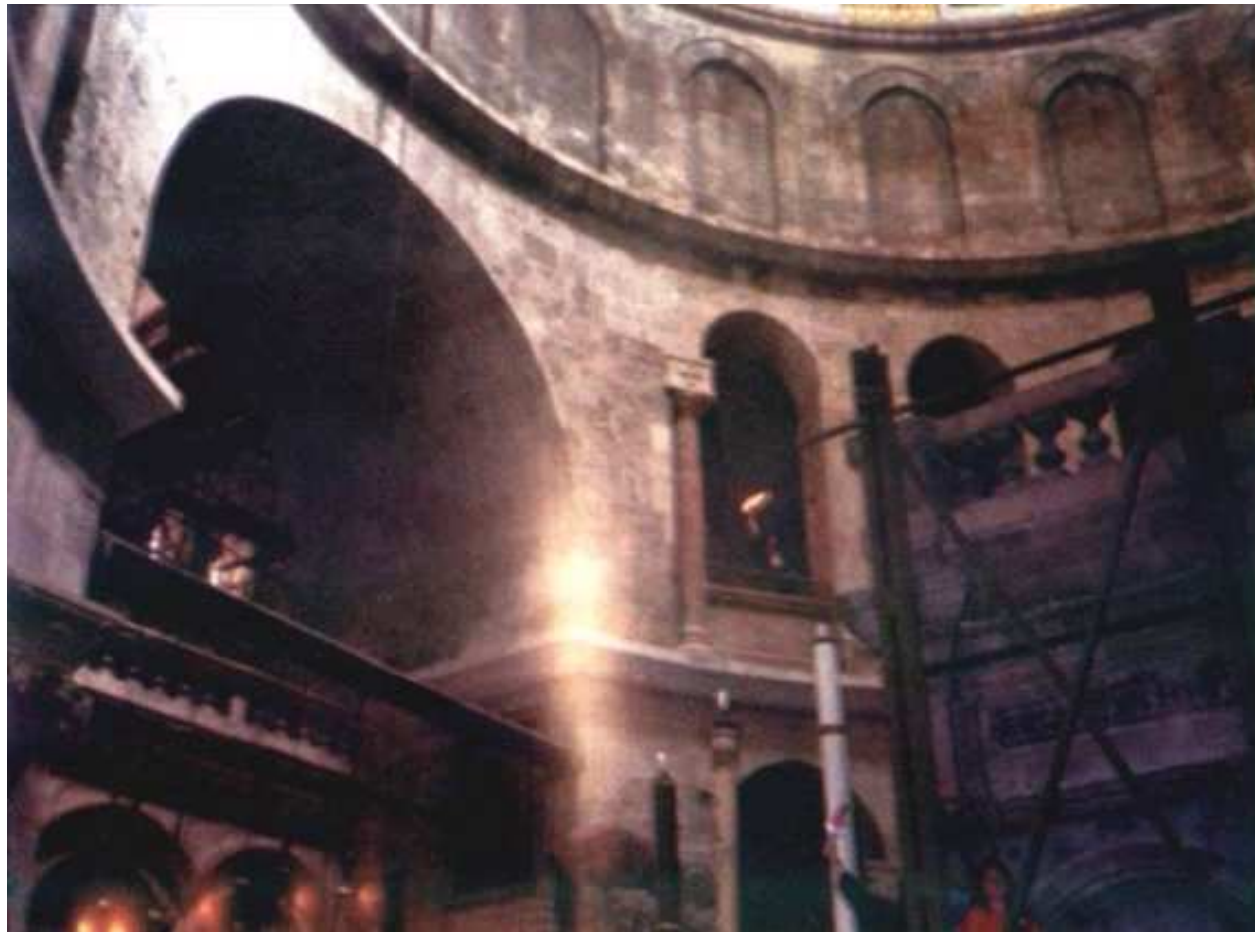
La Santa Luz llamado del Sepulcro La Iglesia del Santo Sepulcro, Jerusalén http://www.holyfire.org