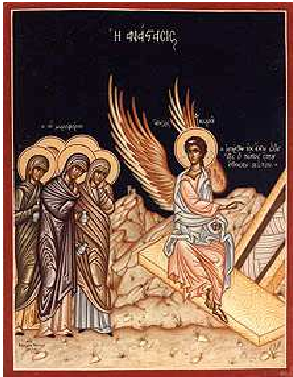
Las Mirraforas y el sepulcro vacío