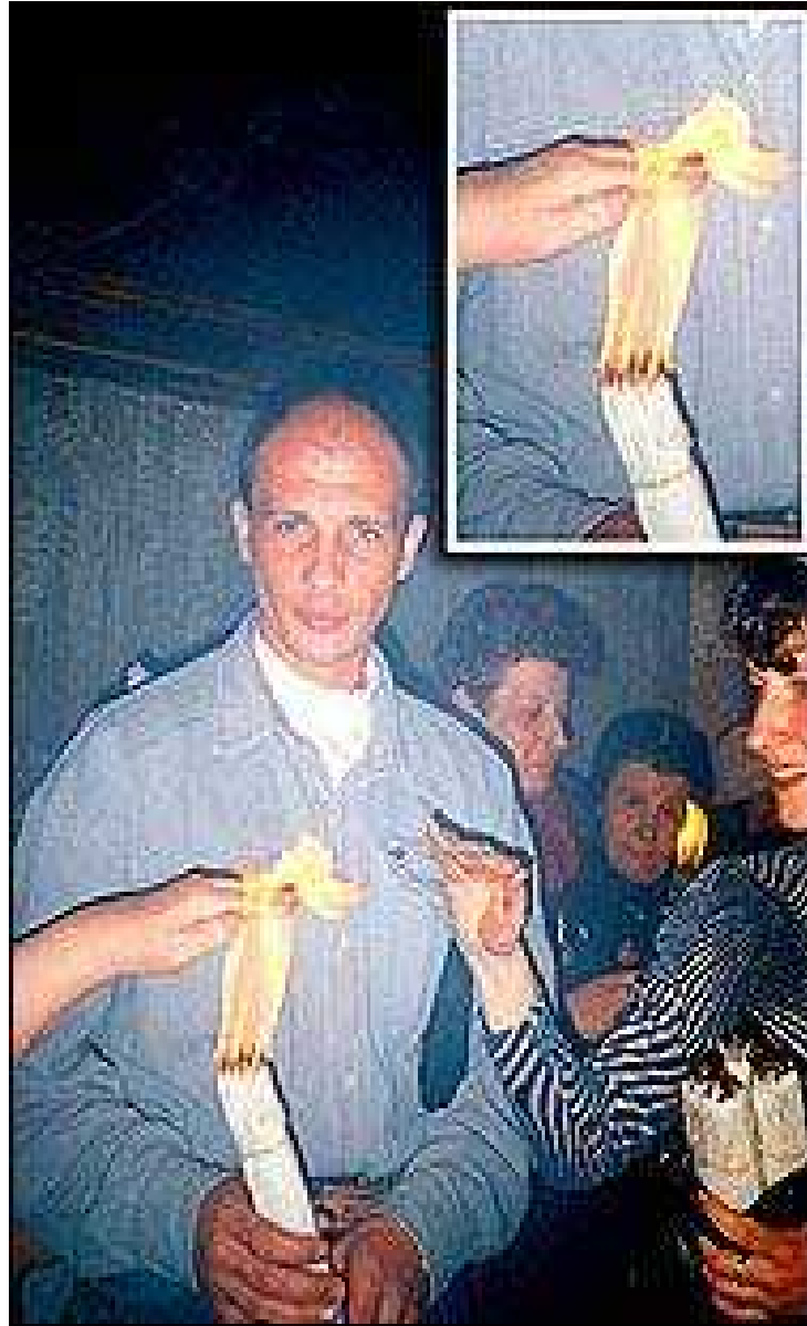
La Santa Luz llamado del Sepulcro La Iglesia del Santo Sepulcro, Jerusalén http://www.holyfire.org