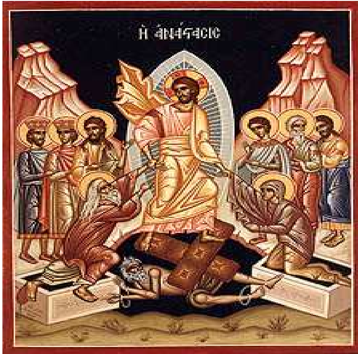
Desgarrador del Hades