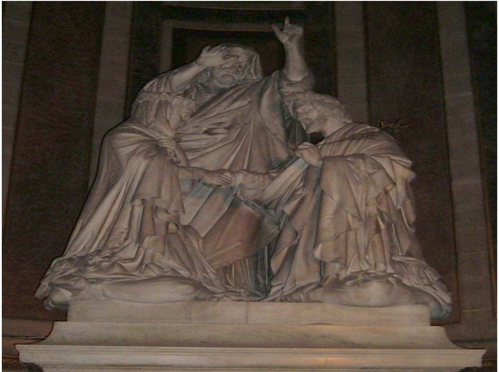
Los esponsales de María y José La Iglesia de María Magdalena, Paris